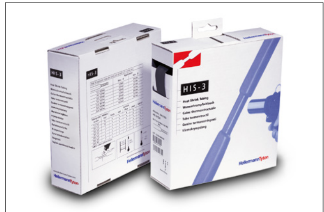
HIS-3 passer der det er store variasjoner i dimensjoner.